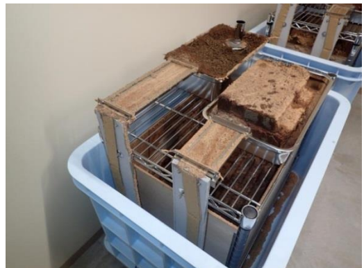
写真1 イエシロアリ営巣飼育装置