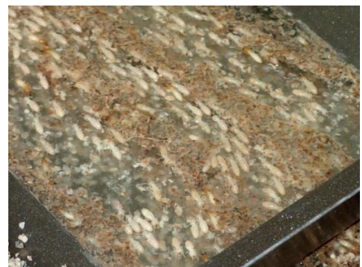
写真2 水取装置へのシロアリ挙動